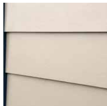
Hardie® Plank Horizontální montáž s překryvem spár, hladká struktura

Obklad Hardie® VL Plank Jednoduché spojení fasádních obkladů Hardie® VL Plank vytváří nadčasový architektonický design - v horizontálním i vertikálním směru. Navíc je instalace až o 20 % rychlejší než u podobných systémů.