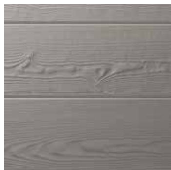
Hardie® VL Plank Horizontální montáž spoj péro-dřážka

Obklad Hardie® VL Plank Jednoduché spojení fasádních obkladů Hardie® VL Plank vytváří nadčasový architektonický design - v horizontálním i vertikálním směru. Navíc je instalace až o 20 % rychlejší než u podobných systémů.