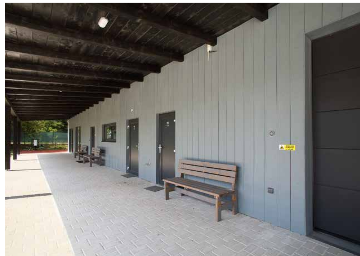
Hardie® Plank , vertikální instalace s přiznanou spárou, struktura dřeva – barva: Ocelově šedá Klubovna orientačních běžců Pardubice, foto: Martin Kovář.