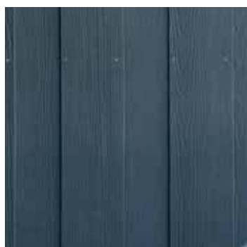
Hardie® Plank Vertikální montáž s překryvem spár, struktura dřeva

Navrhněte si design fasády vodorovně, svisle, s překrytím nebo s otevřenou spárou (nebo kombinujte) – instalace je jednoduchá, rychlá a nabízí maximální flexibilitu.