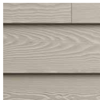
Hardie® Plank Horizontální montáž s překryvem spár, struktura dřeva

Obklad Hardie® Plank Dodejte své fasádě individuální kouzlo, kombinujte horizontální a vertikální linie nebo si vyberte ze tří různých druhů instalace.