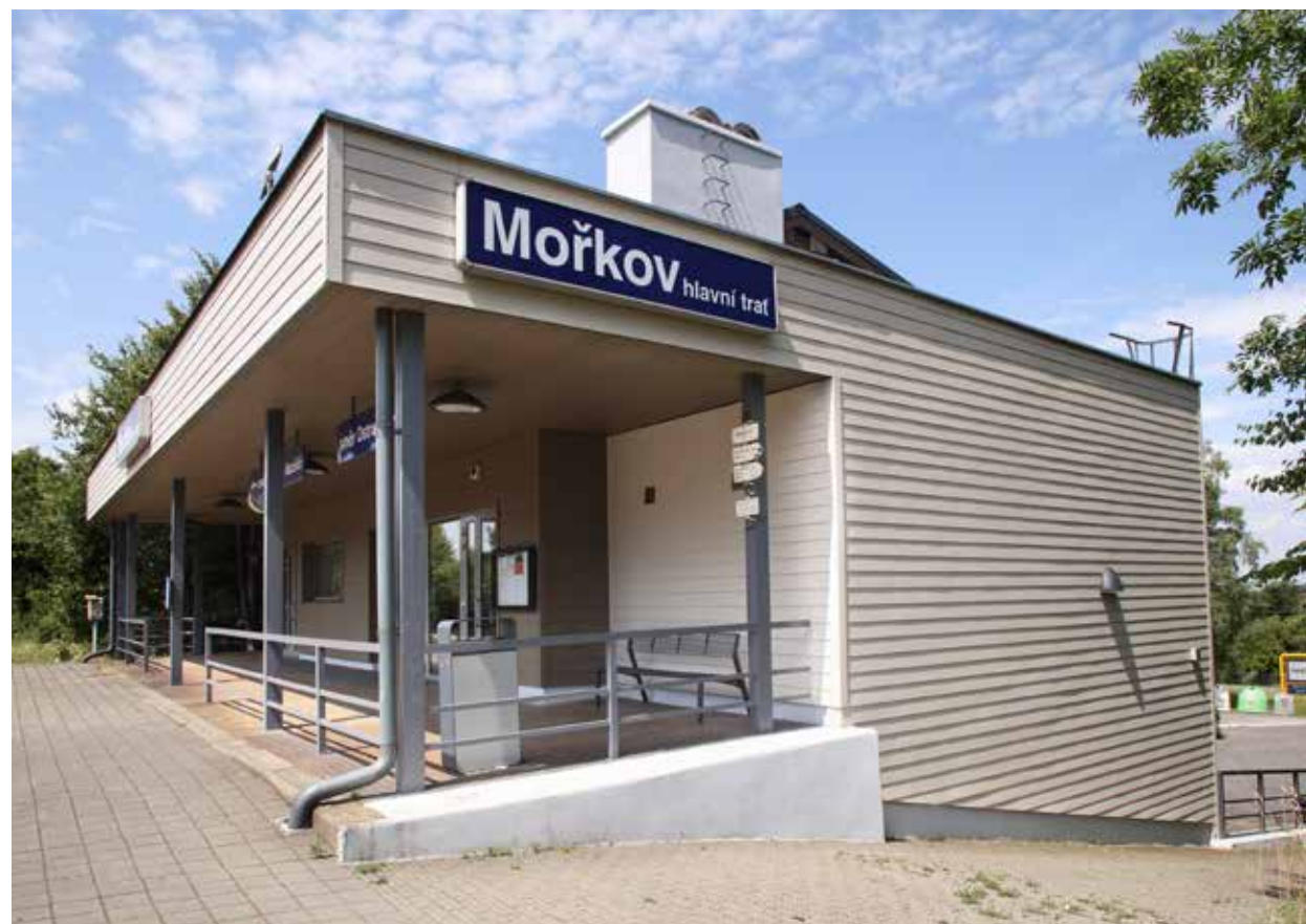
Hardie® Plank , horizontální montáž – barva: Štěrkově šedá a Espresso. Příklad fasády, kde původní dřevěný obklad po devíti letech od instalace zdegradoval natolik, že musel být kompletně vyměněn. Nádraží Mořkov, foto: Martin Kovář.