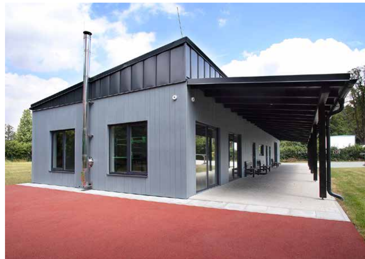
Hardie® Plank , vertikální instalace s přiznanou spárou, struktura dřeva – barva: Ocelově šedá Klubovna orientačních běžců Pardubice, foto: Martin Kovář.