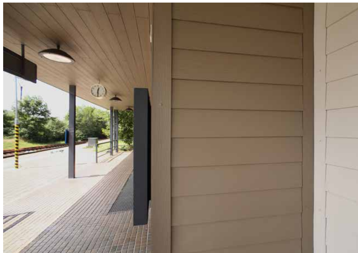
Hardie® Plank , horizontální montáž – barva: Štěrkově šedá a Espresso. Nádraží Mořkov, foto: Martin Kovář.