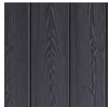
Hardie® VL Plank Vertikální montáž spoj péro-dřážka

Hardie® Plank , kombinace horizontálního obkladu s peřením a vertikálního s přiznanými spárami – struktura dřeva, barva: Khaki hnědá