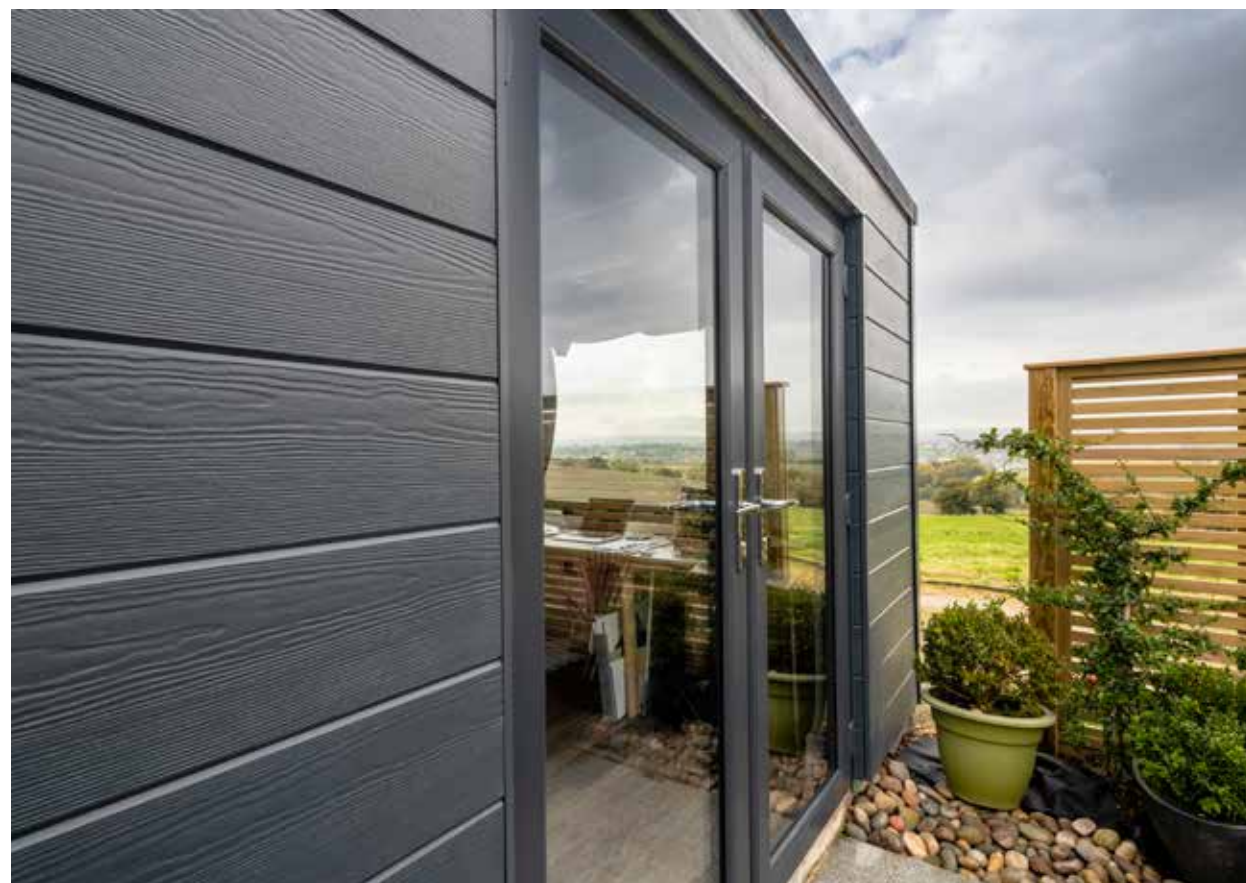
Hardie® VL Plank – barva: Antracitově šedá