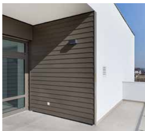
Hardie® Plank a Hardie® Panel v barvě Espresso, struktura hladká