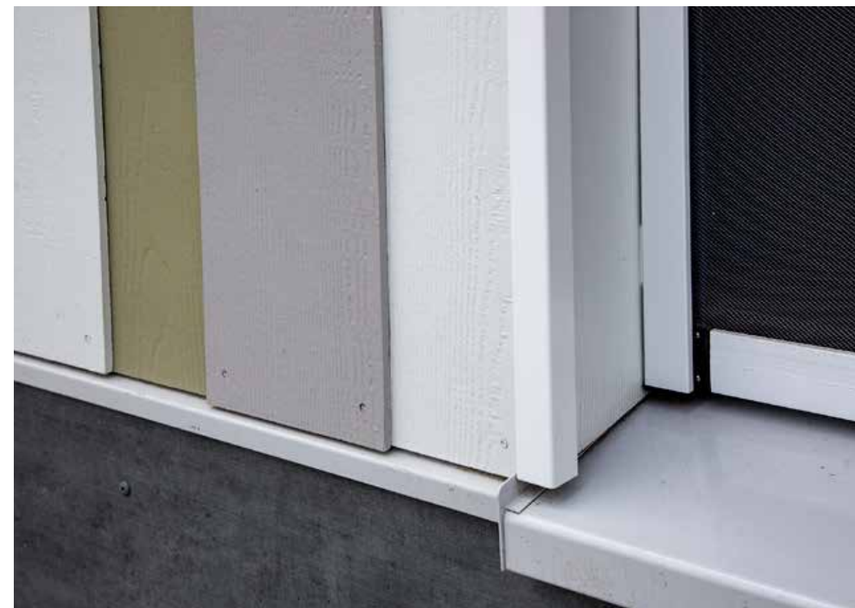
Hardie® Plank v exteriéru: vertikální montáž s překryvem spár, struktura dřeva – barva: Sněhově bílá, Břidlicově šedá a Mechově zelená. Základní škola IKC Berkelwijk, Holandsko.