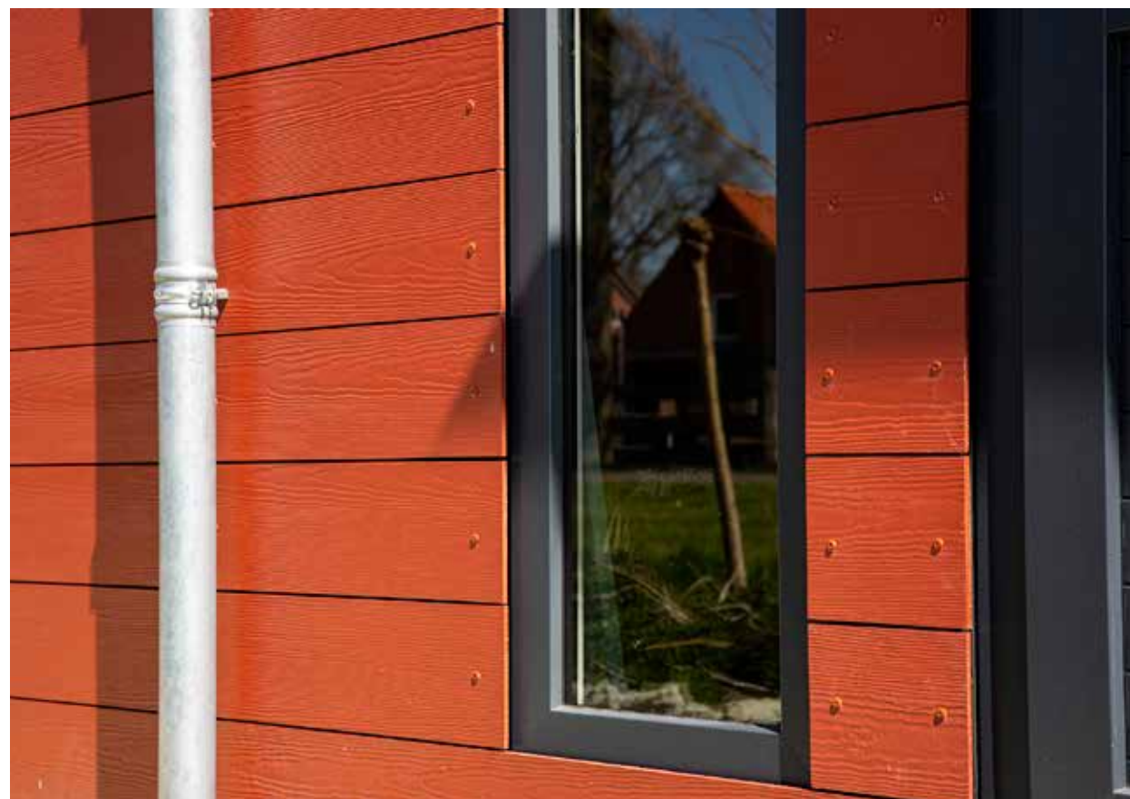
Hardie® VL Plank – barva: Skandinávská červená