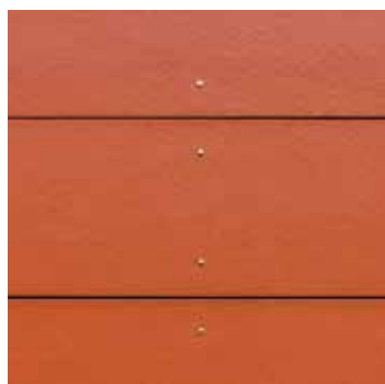
Hardie® Plank Horizontální montáž s viditelnou spárou, hladká struktura

Obklad Hardie® Plank Dodejte své fasádě individuální kouzlo, kombinujte horizontální a vertikální linie nebo si vyberte ze tří různých druhů instalace.