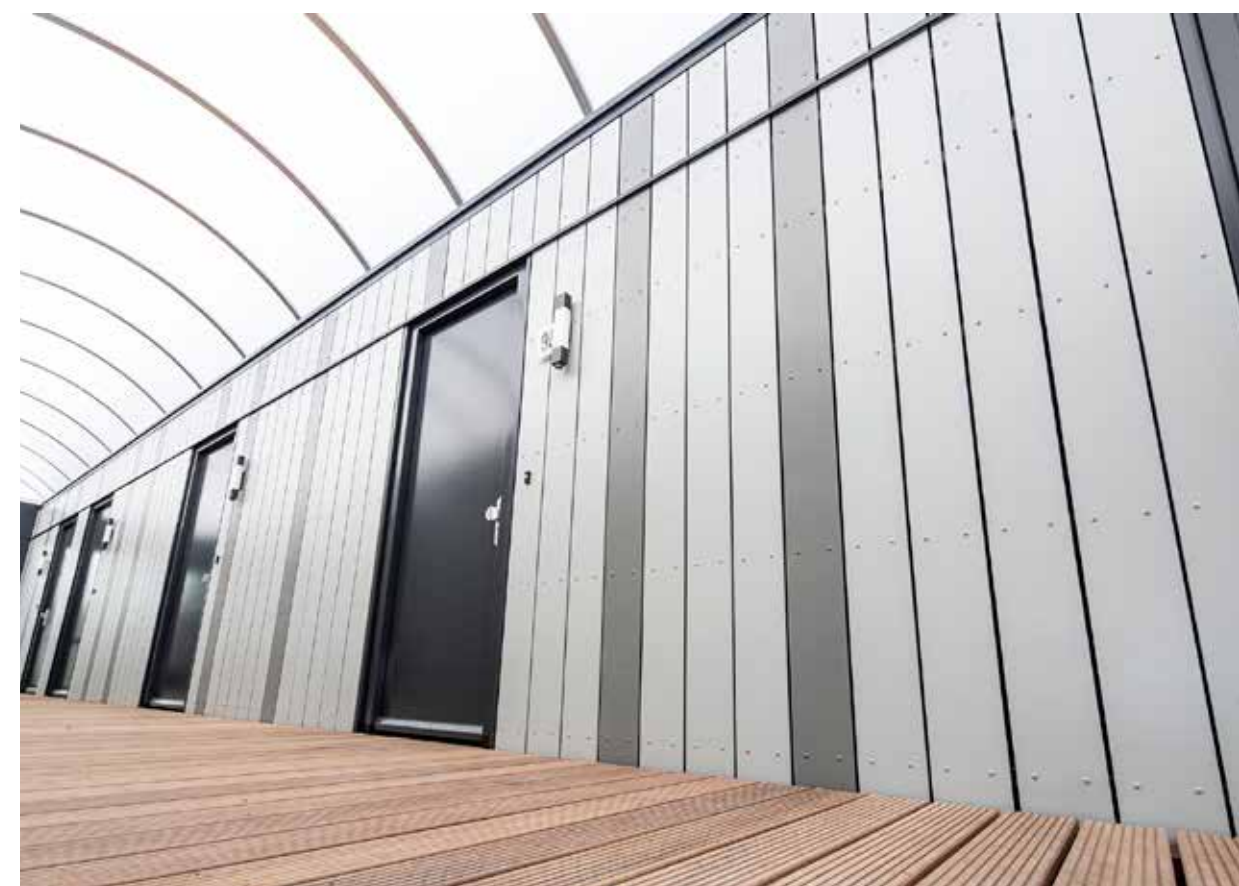
Hardie® Plank v interiéru: horizontální montáž s viditelnou spárou, hladká struktura – barva: Sněhově bílá a Břidlicově šedá. Studentské bydlení, Holandsko.